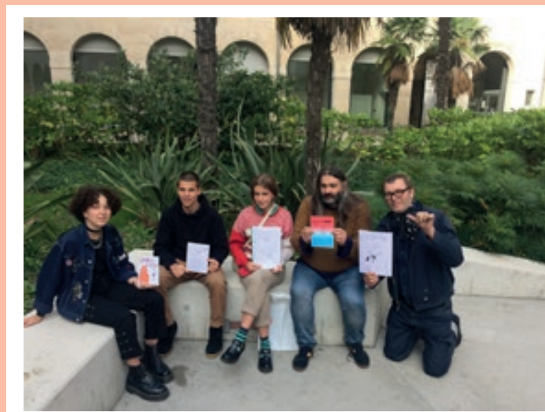
Le jury pose avec les fanzines vainqueurs.